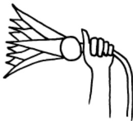
El loto, la flor que escondía el espíritu de Ra.

Los mitos de esta flor de loto, un símbolo egipcio muy importante desde la Antigüedad hasta nuestros días, son característicos de la mitología de esta antigua cultura. Los misterios de la naturaleza que influían directamente en la vida diaria, en especial el movimiento del sol, se explicaron mediante historias que combinaban los deseos de la humanidad por comprender el origen de todas las cosas como la realidad de unos hechos políticos. El mito del loto ocupó un lugar entre los acontecimientos más importantes de la mitología egipcia: la creación, la regeneración diaria o el rejuvenecimiento del espíritu y, por tanto, también en la política.