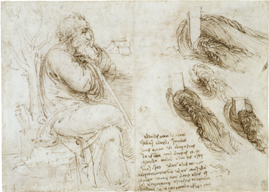
Remolinos en el agua semejantes al cabello: Un hombre sentado (¿san José?), y Estudios y notas sobre el movimiento del agua , c. 1510. Pluma y tinta sobre papel, 15,4 × 21,7 cm.