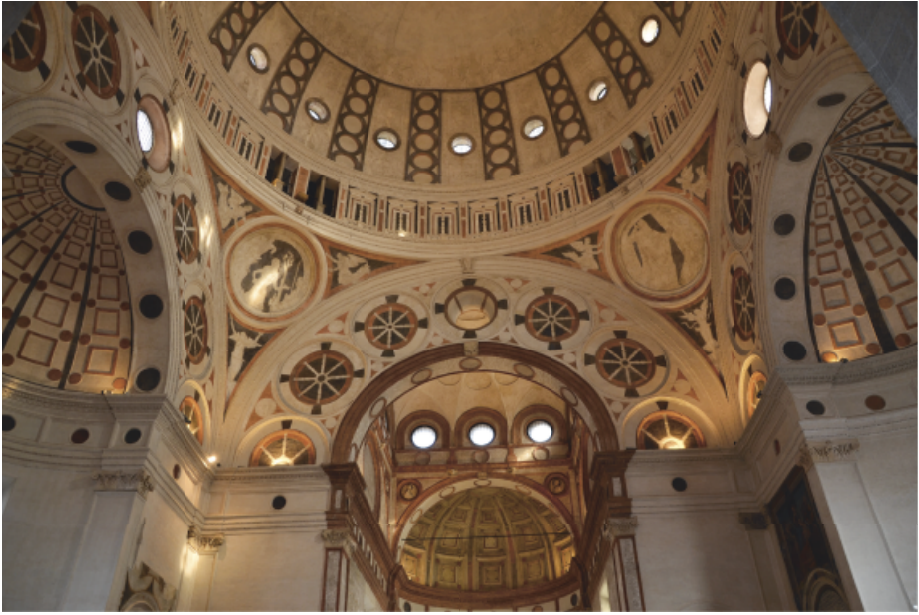
Sólidos geométricos de Donato Bramante en Santa Maria delle Grazie, Milán.