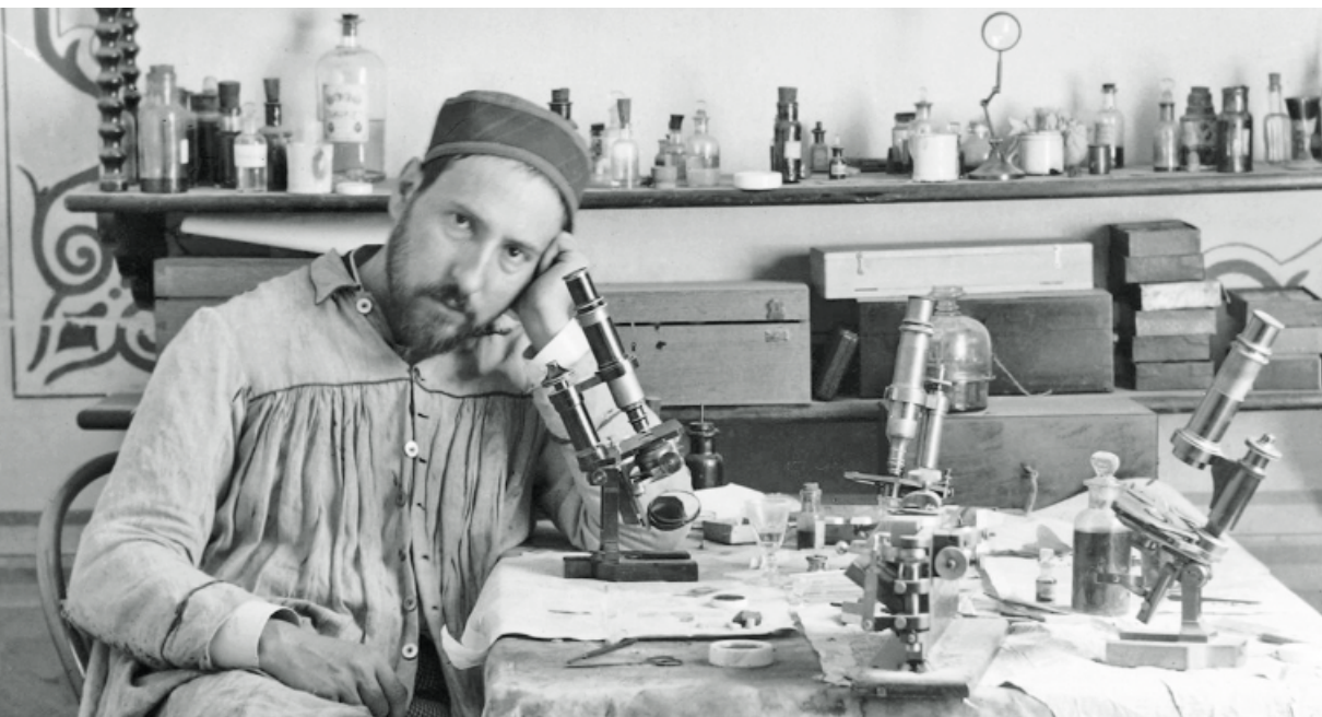
Autorretrato de Cajal en su laboratorio de Valencia, hacia 1885.