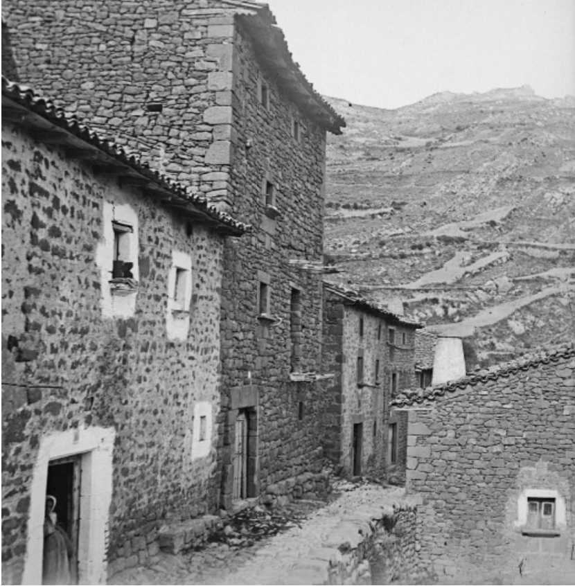
Casa de Petilla de Aragón en la que nació Santiago Ramón y Cajal. Fotografía realizada por Cajal, que ilustra su obra Recuerdos de mi vida (vol. I).

Durante la infancia, Cajal se desarrolló en unas condiciones de vida sumamente precarias. Su padre realizó un gran esfuerzo para cualificarse profesionalmente y eludir la pobreza. Tras ganarse la vida trabajando como pastor, mancebo, barbero, practicante y sangrador, a los veinte años emprendió viaje a pie a Barcelona para buscar me-